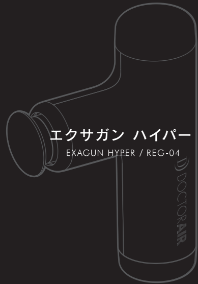
エクサガン ハイパー EXAGUN HYPER / REG-04