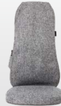
グレー (MS-03 GR) JAN:4580235555606