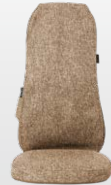
ベージュ (MS-03 BE) JAN:4580235555590